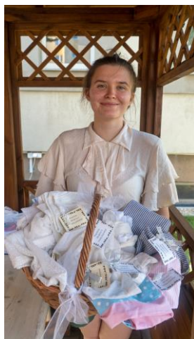
Diecezja zielonogórsko- gorzowska, projekt 2019 – szycie woreczków z firan