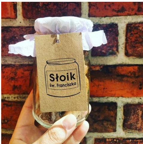
Diecezja koszalińsko-kołobrzaska, projekt 2019 – słoik św. Franciszka